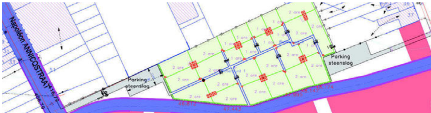
Grondplan Volkstuinsite De Kloef

Volkstuinparken hebben een uitgesproken meerwaarde. Ze bieden meer groene ruimte, een rustige natuurlijke plek in een dichtbevolkte wijk. Ze zijn niet gebonden aan bevolkingsgroepen of aan leeftijden en voor iedereen toegankelijk. Financieel zijn ze heel laagdrempelig, wat het toetreden eenvoudig maakt.