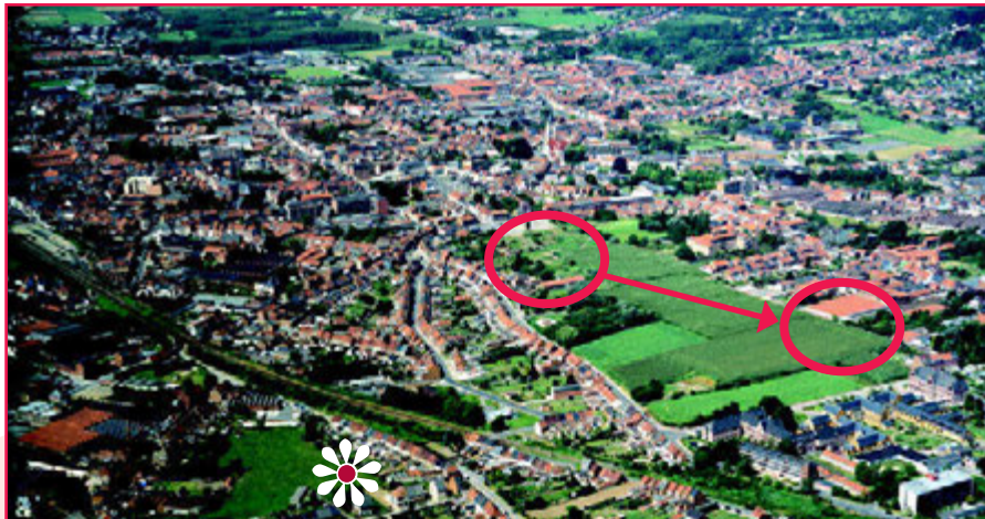
De Kloef, elf hectare landbouwgrond, vlakbij het Ronsese stadscentrum/ In kader van een ambitieus stadsvernieuwingsproject, krijgen de volkstuiniers een nieuwe plek in het geheel.

Samenlevingsopbouw Oost-Vlaanderen realiseerde het volkstuinproject samen met de bewonersgroep, de volkstuiniers, het stadsbestuur en de Koninklijke Volkstuinvereniging tot een gedragen initiatief.